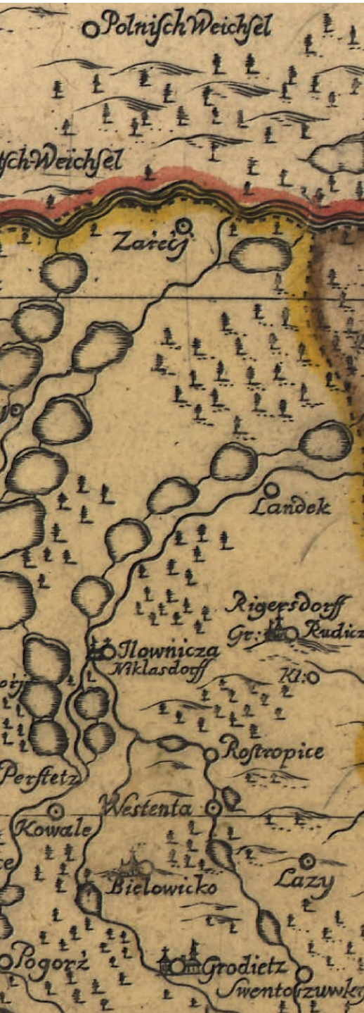
Ryc. 5. Okolice Drogomyśla na cieszyńskim wydaniu mapy księstwa cieszyńskiego Jonasza Nigriniego Ducatus in Silesia Superiore Teschinensis cum adjacentibus Regnorum vicinorum, Hungariae videlicet et Poloniae, nec non Marchionatus Moraviae etc. Terminis Mappa specialis, [Cieszyn] 1724 | BUP, Pracownia Zbiorów Kartograficznych, sygn. M/4086