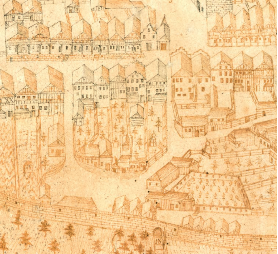
Ryc. 13. Dom kanclerza Jana Czeli w Cieszynie przy ówczesnej ulicy Polskiej vis-à-vis Starego Targu (dziś ul. Głęboka 15). Po lewej widoczny miedzuch prowadzący na tył domu do studni brackiej. Perspektywiczny widok Cieszyna, 2 poł. XVIII w. | MSC, MH, sygn. MC/H/5633