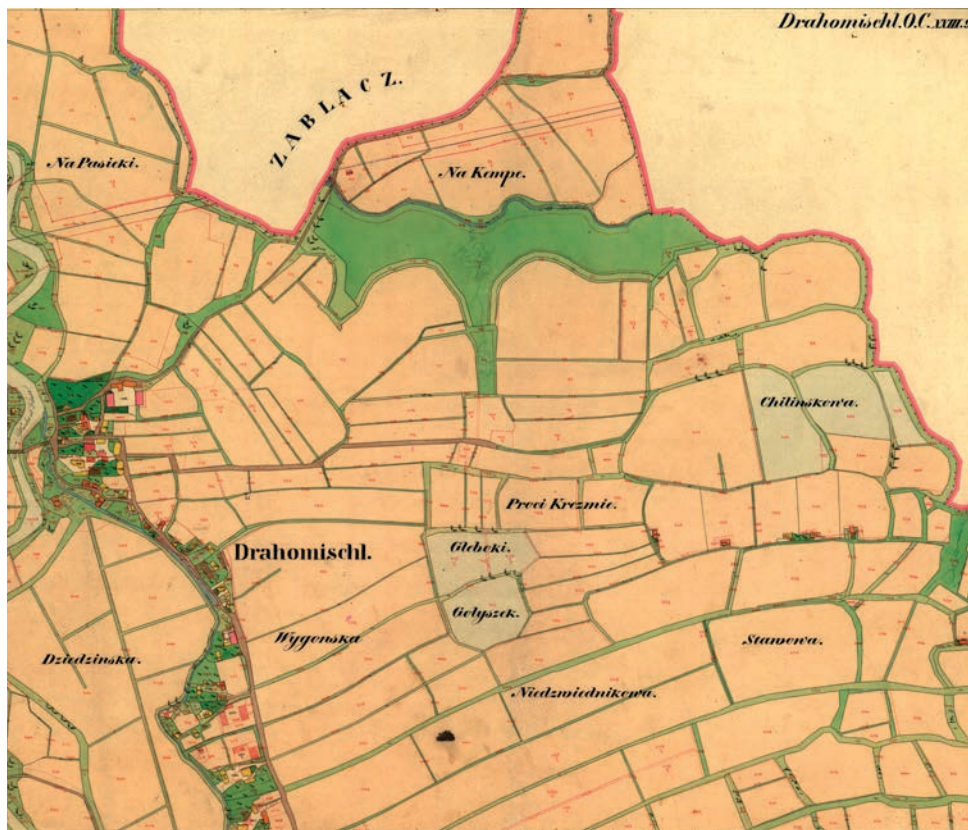
Ryc. 10. Drogomyśl na sekcji 3 planu katastralnego z roku 1836 Drahomischl (Dragomyśl) und Colonie Knay in Schlesien Teschner Kreis Bezirk Teschner Kammer | Starostwo Powiatowe w Cieszynie, Wydział Geodezji, Kartografii i Katastru