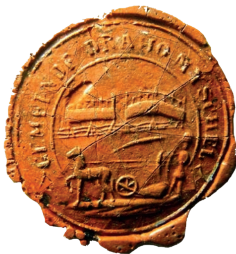
Ryc. 2. Druga pieczęć Drogomyśla, odcisk z roku 1855 | Archiwum parafii ewangelicko-augsburskiej w Drogomyślu, Zbiór dokumentów luźnych, brak sygnaturoku, fot. ks. Karol Macura