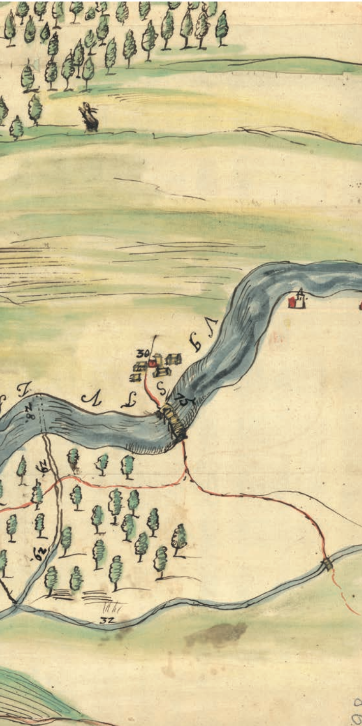
Ryc. 4. Okolice Drogomyśla na fragmencie planu biegu rzeki Wisły na odcinku od Ochab Wielkich do Wisły Małej z roku 1791