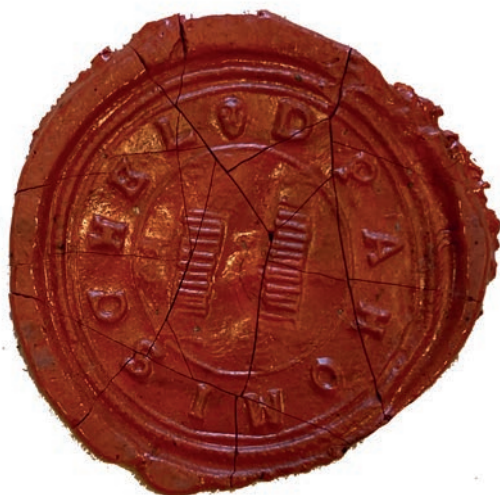
Ryc. 1. Pierwsza pieczęć Drogomyśla, odcisk z roku 1793 | APC, KC, sygn. 2148